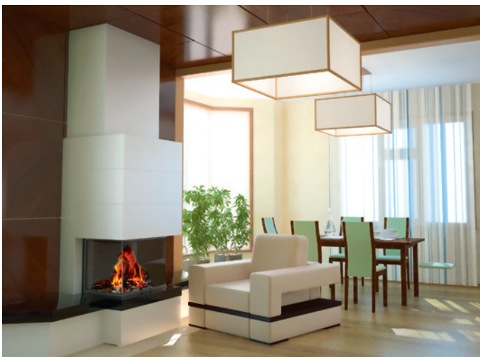
Mit individuellen Zubehörteilen sorgt Camina für noch mehr Gestaltungsmöglichkeiten.

verkleidungen, die auf Kundenwunsch als Sonderanfertigung für die Brillance erhältlich sind und sich nahtlos in das Montagekonzept der K-Serie einfügen. Das heißt: kinderleichte Montage und zahlreiche Verkleidungs- und Variationsmöglichkeiten des aufwendigen Zubehörs. Und wer also das eine oder andere Bauteil nach individueller Form und Idee benötigt, dem hilft der Camina-Planungs- und Konstruktionservice weiter. So wird aus dem K-Serienmodell immer wieder ein echtes Unikat.