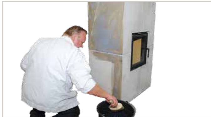
Silikat-Grund ELF 1803 1:1 mit Wasser verdünnen und gleichmäßig auftragen.

(viele Farbtöne nach Absprache in der Brillux Niederlassung möglich)