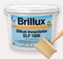
Silikat-Innenfarbe ELF 1806, Streichbürste oval 1175